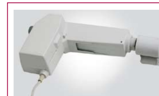
AC70 Motori con sistema spline (antisciacciamento ed anticesoamento) Motors with spline system/anti-cutting