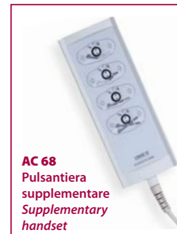
AC 68 Pulsantiera supplementare Supplementary handset