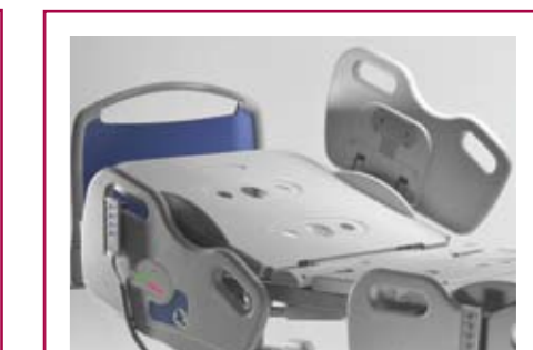
AC 71 Semi sponde laterali a scomparsa solo per modello ALEX Half-sides cot (foldaway) only for ALEX model

Pannelli disponibili nei seguenti colori - Panels are available in the following colors