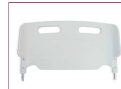
AC 65/1 Coppia spalle asportabili in tecnopolimero "sagomate" solo per modello ALEX Twin shoulders removable in technopolymer - "curved" only for ALEX model