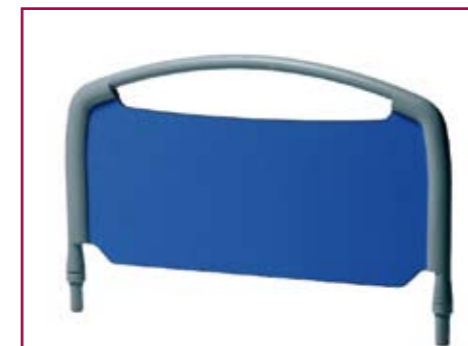
AC 65 Coppia spalle asportabili con pannello in tecnopolimero solo per modello ALEX Twin shoulders removable in technopolymer only for ALEX model