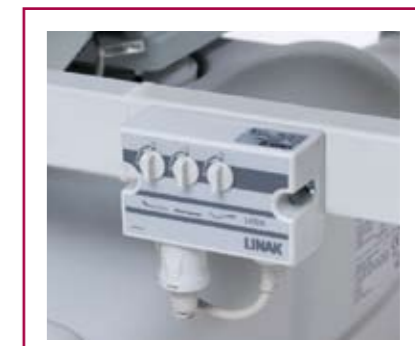
AC 66 Control box con esclusione comandi Control box with exclusion commands